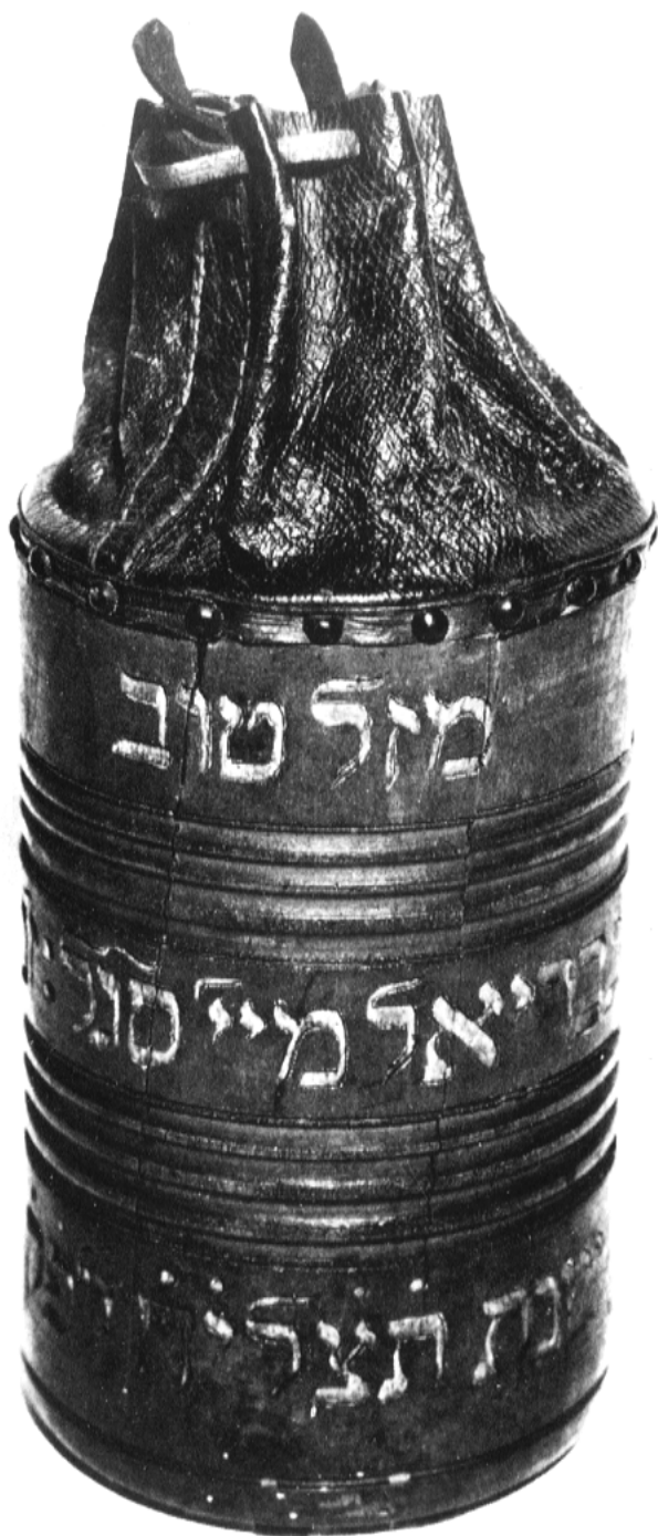
XII — Aumônière pour la quête de mariage, Alsace, 1768